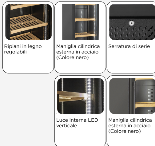
Ripiani in legno regolabili