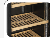
Ripiani in legno regolabili