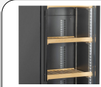
Maniglia cilindrica esterna in acciaio (Colore nero)