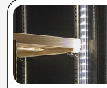
Luce interna LED verticale