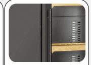
Maniglia cilindrica esterna in acciaio (Colore nero)