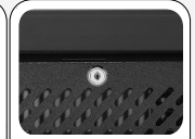
Serratura di serie