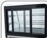
Porte scorrevoli posteriori