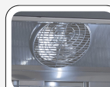
Ventilatore interno di assistenza