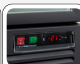
Interuttore generale, interuttore luce e termostato digitale di serie