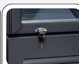
Serratura di serie