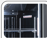
Luce LED interna