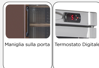
Maniglia sulla porta