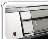
Porte scorrevoli posteriori