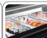
Doppia temperatura tra sopra/sotto per alimenti con massimo richiesta di freddo (SUSHI)