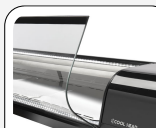
Vetro curvo temperato a cerniera per una facile pulizia