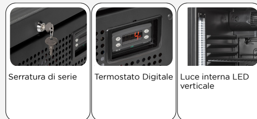
Serratura di serie