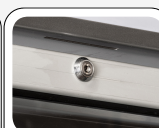
Serratura di serie