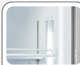
Luce interna LED verticale