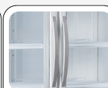
Maniglia esterna in alluminio