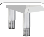
Piedi in acciaio inox regolabili opzionali