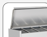
Coperchio in acciaio inox