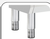
Piedi in acciaio inox regolabili opzionali