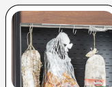
Barra per carni con ganci