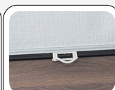
Tenda avvolgibile (In tessuto - Colore grigio)