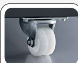
Il prodotto può essere fornito di ruote con freno